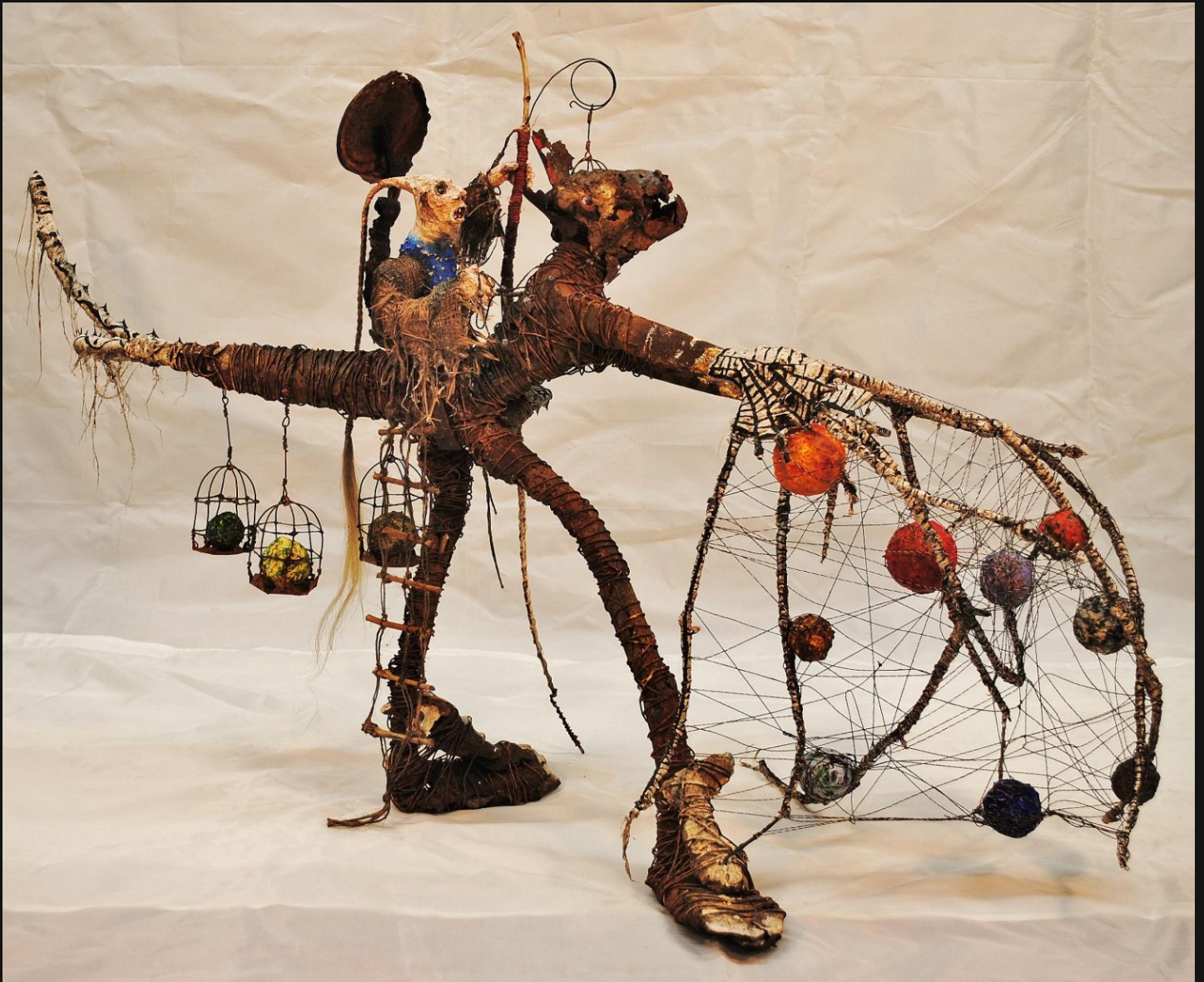
Le pêcheur de lunes