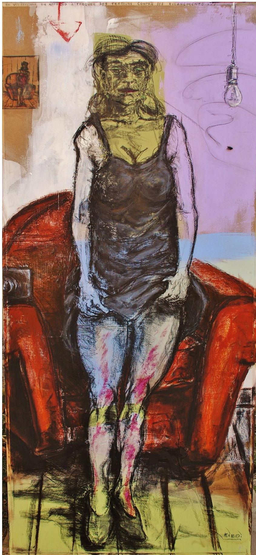
Figure verte 135x60